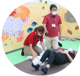
昨年度の家族介護支援教室の様子 講師によるおむつ交換の実技