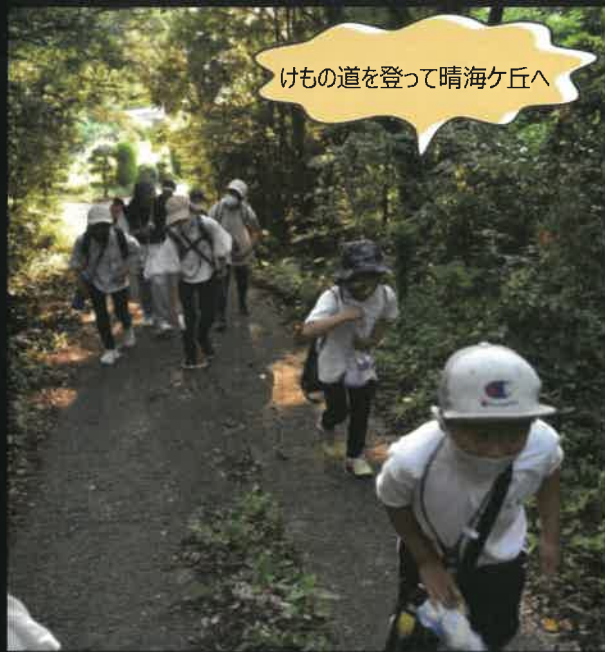
けもの道を登って晴海ヶ丘へ

例年、わんぱく塾で一番沢山の子どもたちが集まって盛り上がるナイトウォーク&キャンプファイヤーは、今年は人数制限をして開催することになり、ちょっとだけ寂しい集まりになりました。それでも66名の子どもたちが、晴海ヶ丘からの夕日を堪能し、『ほねっこ』と一緒にキャンプゲームを楽しみました。 来年もまた、巨大キャンプファイヤーを囲んで、大勢でワイワイガヤガヤ盛り上がりたと思います。