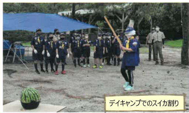
デイキャンプでのスイカ割り