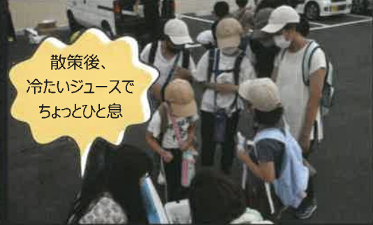
散策後、冷たいジュースでちょっとひと息