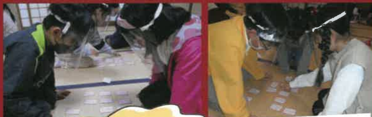
自分の出番以外は みんな静かに観戦&応援