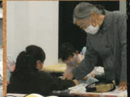
みんな時間いっぱい 一生懸命練習しました