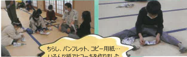
ちらし、パンフレット、コピー用紙… いろんな紙でヒコーキを作りました