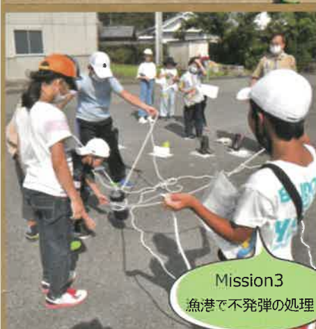
Mission3 魚港で不発弾の処理