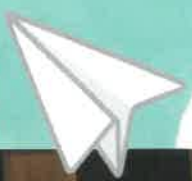
スカウトリーダーと一緒に紙ヒコーキを作って 大ホールで思いっきり飛ばしました。