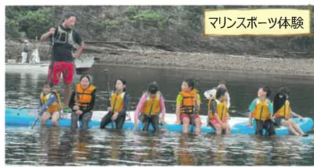
マリンスポーツ体験