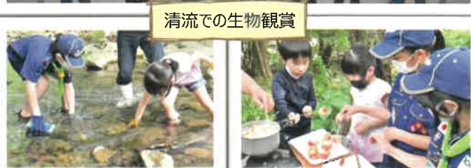
清流での生物観賞