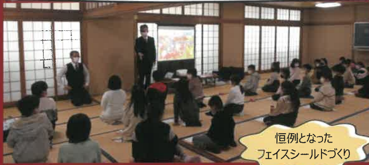
恒例となった フェイスシールドづくり

今年は低学年の児童と初心者の参加者が多かったので、色ごとに優勝を競うのではなく、学年ごとに優勝を競いました。今年の子ども達为上達するスピードの速さには驚かされました。