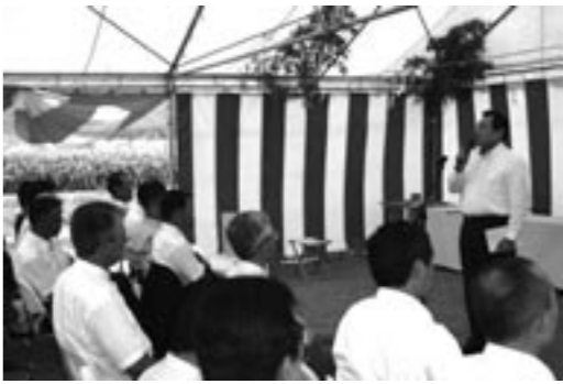
▲市西地区ほ場整備事業の起工式