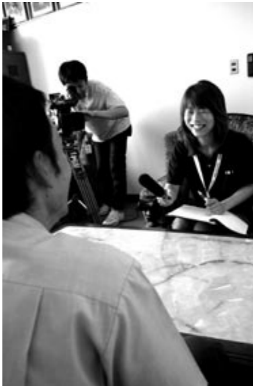
▲地域に密着した情報番組の取材の様子