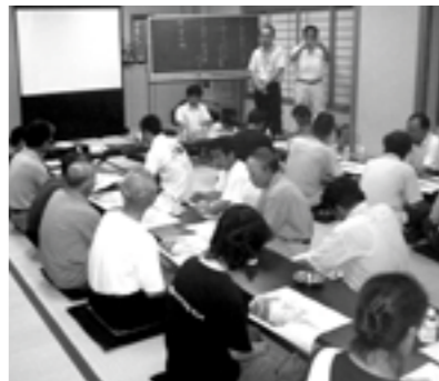
▲阿那賀地区での自主防災検討会

現在、市では自主防災組織の育成に取り組んでいます。自主防災組織というと堅苦しく考えがちですが、個人個人で台風の時には戸を閉めたり、物が飛ばないように準備すると思います。この延長が自主防災組織です。 地域の防災・救助活動を百パーセント、役所や消防、警察などに頼っても限界があります。自分たちで避難、救助活動などが行えるように準備しておくことが重要です。 昨年の台風十六号、十八号によって甚大な高潮被害を受けた阿那賀地区（北栄・中・南）では、今年に入り二回の自主防災検討会が開催されま