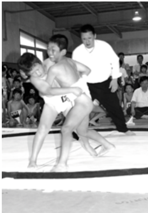
▲第1回南あわじ市少年相撲大会 (南あわじ市体育協会主催)