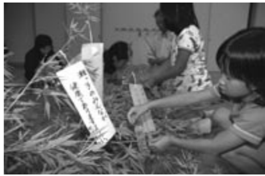
▲短冊を飾る子どもたち

マで、同クラブの会員十人が全校生四十三人に七夕飾りの付け方を指導したほか、当時の祭の様子を語ってくれました。子どもたちは「みんな健康でありますように」「勉強が得意になりますように」などの願いが込められた短冊を笹に付けました。その後、願いが叶うように地元でとれた野菜や果物など