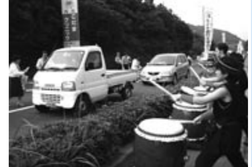
▲交通安全を呼びかける倭文中学校音楽部のメンバー