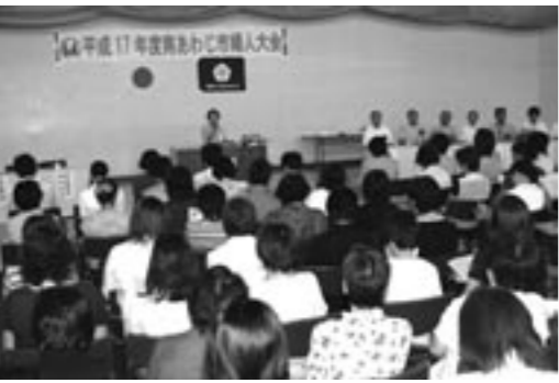
▲盛大に開催された南あわじ市婦人大会

てれば」と思いを述べ、中田市長からも「家庭・地域を守る存在として心強い」と日ごろの努力に感謝を述べました。その後、地域婦人会活動に貢献してきた退任役員らに感謝状が贈呈され、式典終了後には、地区対抗のバレーボール大会で交流を深めました。連合婦人会では、今年四月に県内初めての聴覚障害者特別養護老人ホーム「淡路ふく