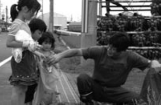
▲道端のゴミを拾う市民(松帆)

淡路島をみんなの手できれいにする全島一斉清掃が7月10日に行われ、多くの方が参加されました。雨が降りしきり中、住民の方々はポイ捨てされた空き缶やゴミなどを拾い集めたほか、草刈り機を使い道端や河川の雑草を刈りました。拾われたゴミなどは各地区の指定された場所に集められ、清掃センターへ集約。市内全域から可燃約30トン、不燃約10トンのゴミが集まりました。