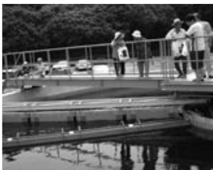
▲下水道施設を見学する住民(福良浄化センター)

市内工事の無料相談所を開設したほか、環境にやさしい家庭用洗剤も配布。四施設で合計約三百六十人が訪れました。 福良浄化センターでは、全国でも珍しい「海水混合棟」という、真水を海水に混ぜて排水する施設もあり、見学者の注目を集めていました。 見学者からは「水がきれいになっていく仕組みがよくわかった」と感想を述べていました。