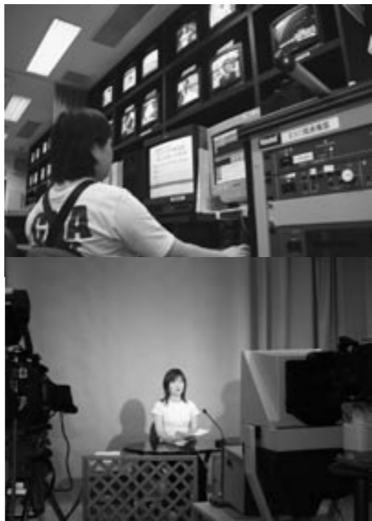
▲さんさんネット自主放送番組の編集・収録の様子

通信速度512kbps。月額基本料金2,625円 (速度増速サービスの場合、プラス1,050円)。加入率28%