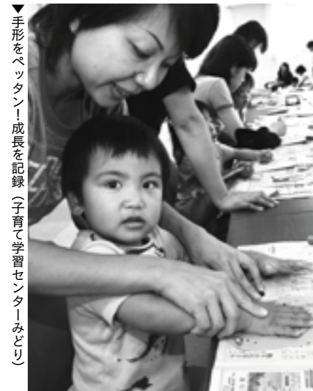
▼手形をベタタン！成長を記録（子育て学習センターみどり）