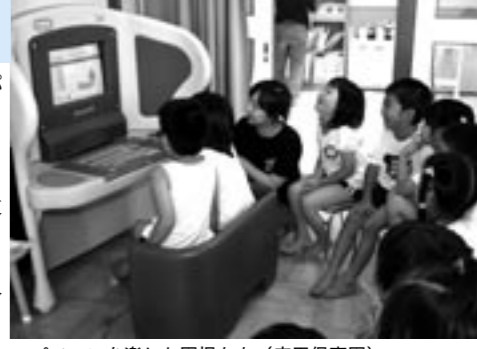
▲パソコンを楽しむ園児たち(広田保育園)

市内の全保育所に園児用パソコンが導入されました。これはパソコンメーカー・日本IBM社が社会貢献として全国に提供している一環で、昨年一部の保育所で導入されていました。このパソコンはゲーム性を取り入れながら、子どもたちの創造力や探究心を引き上げる教育ソフトが多数入っています。6月25日には、このパソコンを保育の中でどのように取り入れればいいのかを学ぶ研修会が行われ、保育士らが受講しました。