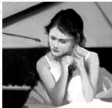
「ピアノの前の踊子」(部分) 1999年

淡路人形座の舞台裏を知る・バックステージツアー 内容 淡路人形教室、舞台裏や道具類の見学、公演の鑑賞など 開催日 8月9・10・19・20・21・26・27・28日 時間 午前10時55分〜、午後2時55分〜の2回。約1時間40分 場所 淡路人形浄瑠璃館(大鳴門記念館内) 募集人数 各30人 参加費 小学生420円、中学生525円、大人630円 申込み 淡路人形浄瑠璃館 ☎52-0260