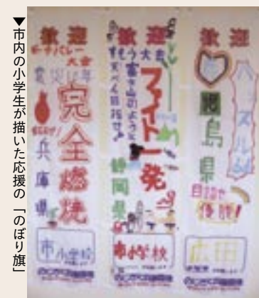
▼市内の小学生が描いた応援の「のぼり旗」

また、市内の小学生が各都道府県に向けての応援メッセージを描いた手作り「のぼり旗」を会場周辺の沿道に設置していますので、こちらもご注目ください。 去る六月十九日(日)に「第八回兵庫県ビーチバレー高等学校選手権大会」と、七月二日(土)に「第一回南あわじ市少年相撲・少女新相撲大会」が行われ、優勝者に「はばたん」のぬいぐるみが副賞として授与されました。