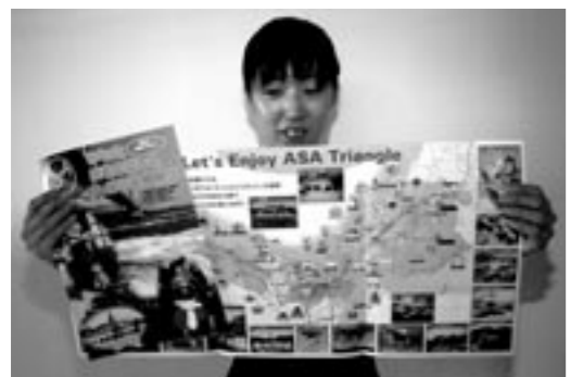
▲3市の観光・特産品などを紹介したパンフレット

たものです。 パンフレットは見開き地図にイングラランドの丘や渦の道、白鳥温泉など各市八か所ずつ観光スポットを掲載しているほか、手延べ素麺やなると金時、讃岐和盆糖などの特産品も写真で紹介。各市一万部ずつ計三万部を作成し、観光施設やサービスエリア、庁舎などで配布しています。