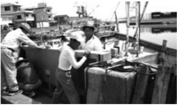
▲防潮扉を閉める住民(湊港)

台風時の高潮被害に備えた、「高潮対策訓練」が島内全域の海岸や港湾などで六月二十八日に実施され、南あわじ市内でも福良港や湊港、灘海岸、津井海岸で関係者らが参加しました。 訓練では、午前九時三十分