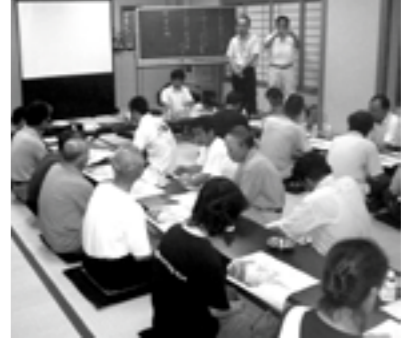
▲阿那賀地区での自主防災検討会

現在、市では自主防災組織の育成に取り組んでいます。自主防災組織というと堅苦しく考えがちですが、個人個人で台風の時には戸を閉めたり、物が飛ばないように準備すると思います。この延長が自主防災組織です。地域の防災・救助活動を百パーセント、役所や消防、警察などに頼っても限界があります。自分たちで避難、救助活動などが行えるように準備しておくことが重要です。昨年の台風十六号、十八号によって甚大な高潮被害を受けた阿那賀地区（北栄・中・南）では、今年に入り二回の自主防災検討会が開催されま