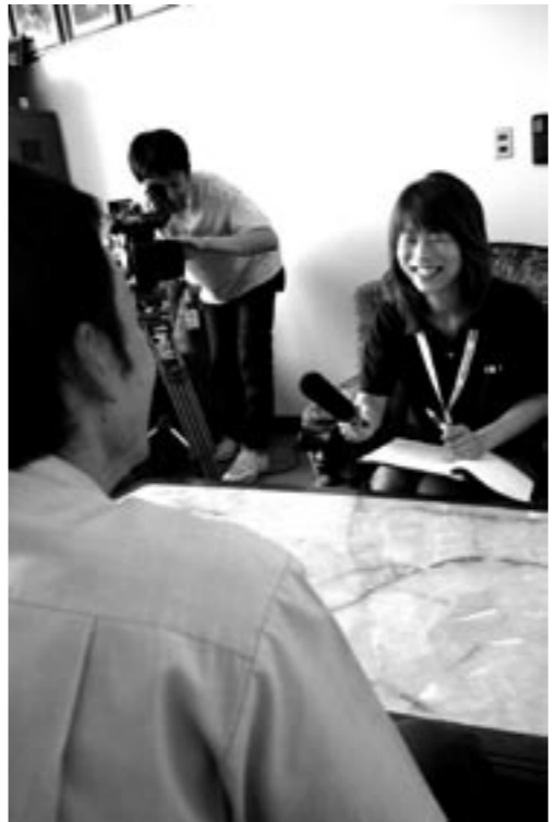
▲地域に密着した情報番組の取材の様子