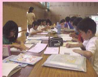
放課後子ども教室