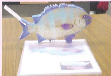
工作作品（鉛筆立て）