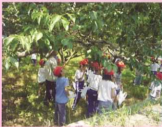
環境体験事業 (小学校 3 年生)