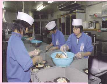
トライやる・ウィーク (中学校 2 年生)