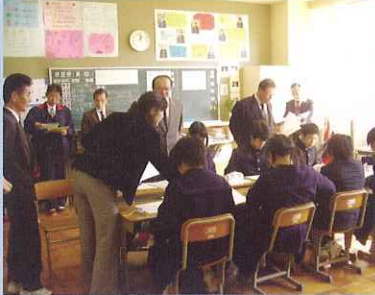
人権教育授業研究会（小・中学校）