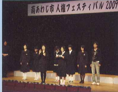
人権フェスティバル