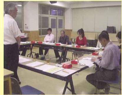
学校評議員会（各学校）