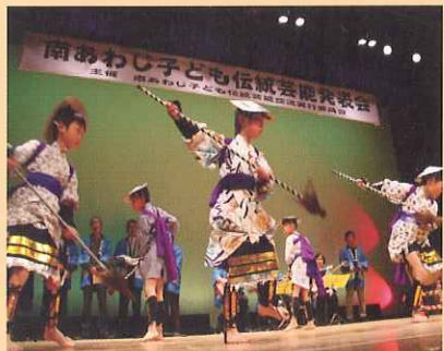
（子ども伝統芸能発表会より）