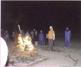
自然学校 (小学校 5 年生)