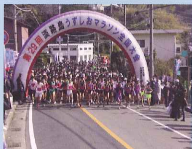
うずしおマラソン全国大会