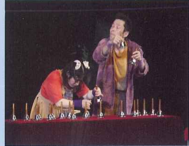
セリフのない音楽劇