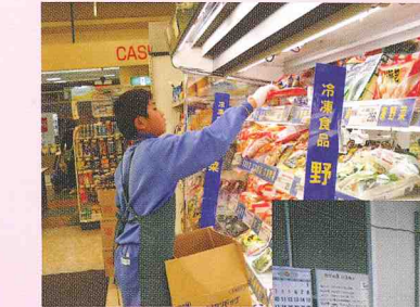
トライやる・ウィーク (中学校 2 年生)