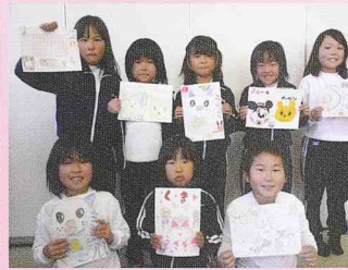
放課後子ども教室