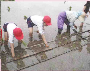
環境体験事業 (小学校 3 年生)