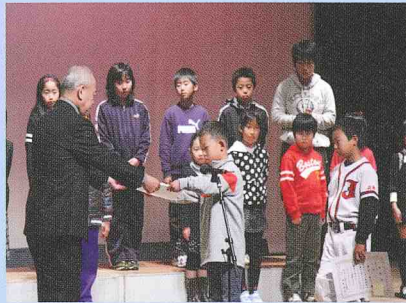
人権フェスティバル