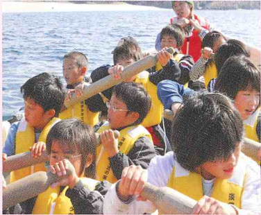
自然学校 (小学校 5 年生)