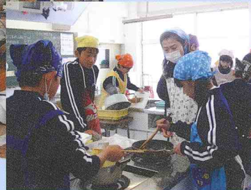
学校支援ボランティア（学校支援地域本部事業）