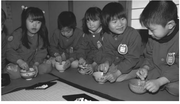
▼赤い毛せんに正座してお点前を体験しました

2月25日、湊幼稚園児17人が智積寺(湊)のお茶会に招待され、お点前を体験しました。 同寺では毎年ひな祭りを前に園児を招待してお茶会を開催。今年は更正保護女性会西淡支部会員も参加し、園児たちに手作りの茶菓子と抹茶を振る舞いました。 また、園児たちは同支部会員に教わりながら茶せんでお茶をたて、おいしそうに味わっていました。