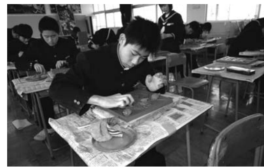
▲ヘラなどを使って、鬼瓦を制作する生徒たち