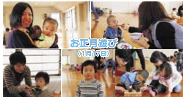
園子育て学習・支援センター ☎42-7703、9:00~16:00