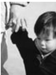
※虐待から救うには大人の気づきと援助が必要で

育児や子育てに悩んだ時、虐待を受けたと思われる子どもを見つけた時などに、全国共通の番号によって近くの児童相談所に電話が繋がる仕組みが導入されています。 標語 「気づくのはあなたと地域の心の目」