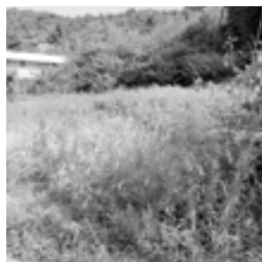
農地を再生した事例。再生前(上)、再生後(下)

要件 ①耕作を放棄している農地を再生し定植する ②果樹栽培で近隣の農地や農作物に悪影響がない ③今後、園地を管理して収穫・販売ができる