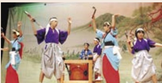
▲八木小学校児童による大久保踊り