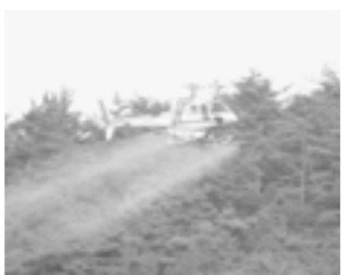
▲散布当日は散布区域内に立ち入らないでください

貴重な松林を松くい虫の被害から守るため、山林へ薬剤の空中散布を行います。 散布地域にお住まいの、お出かけの人はご注意ください。万一、薬剤散布が原因と疑われる症状が出た人は、医療機関で農薬中毒に対する処置を受けてください。