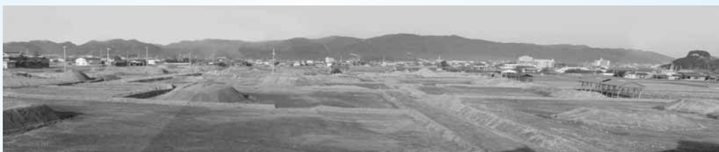
ほ場整備（大日川東Ⅱ期工事、高萩地区）

参加できる要件は。 農業委員会事務局長 役員の1人が常時農業に従事すること。その他契約内容等がある。 問 市内の農地を守るため、一般法人が利用