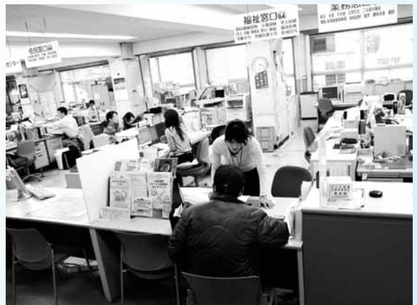
窓口での接客風景（西淡庁舎）

現分庁舎は総て解体・売却とのこと、増々寂れて格差が開く、現方式ではなぜ駄目か。 足湯・バイオマス整備・人形会館等総てが大きく増額した。この件も検討委員会に20億5千万円と説明している。計画の金額は信頼できない。