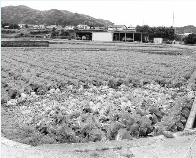
有害鳥獣被害の状況

農業振興部長 ①捕獲隊の増員、駆除体制のさらなる整備を図る。②農協、3市での連携も今後調整。③シカ肉の活用も、県の動向を踏まえ、調査する。 問 人との共生をどう考えるか。 農業振興部長 生物の多