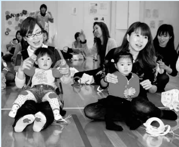
子育て学習・支援センターで遊ぶ親子

市長公室長 会議等で職員の移動でかなりのロスがある。職員の削減計画、スリム化への妨げになっている。