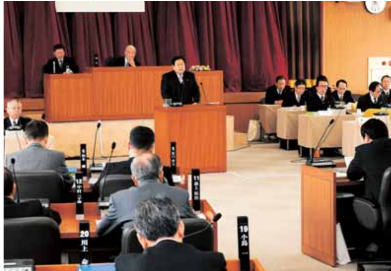
▲22年度の施政方針を表明する中田勝久市長