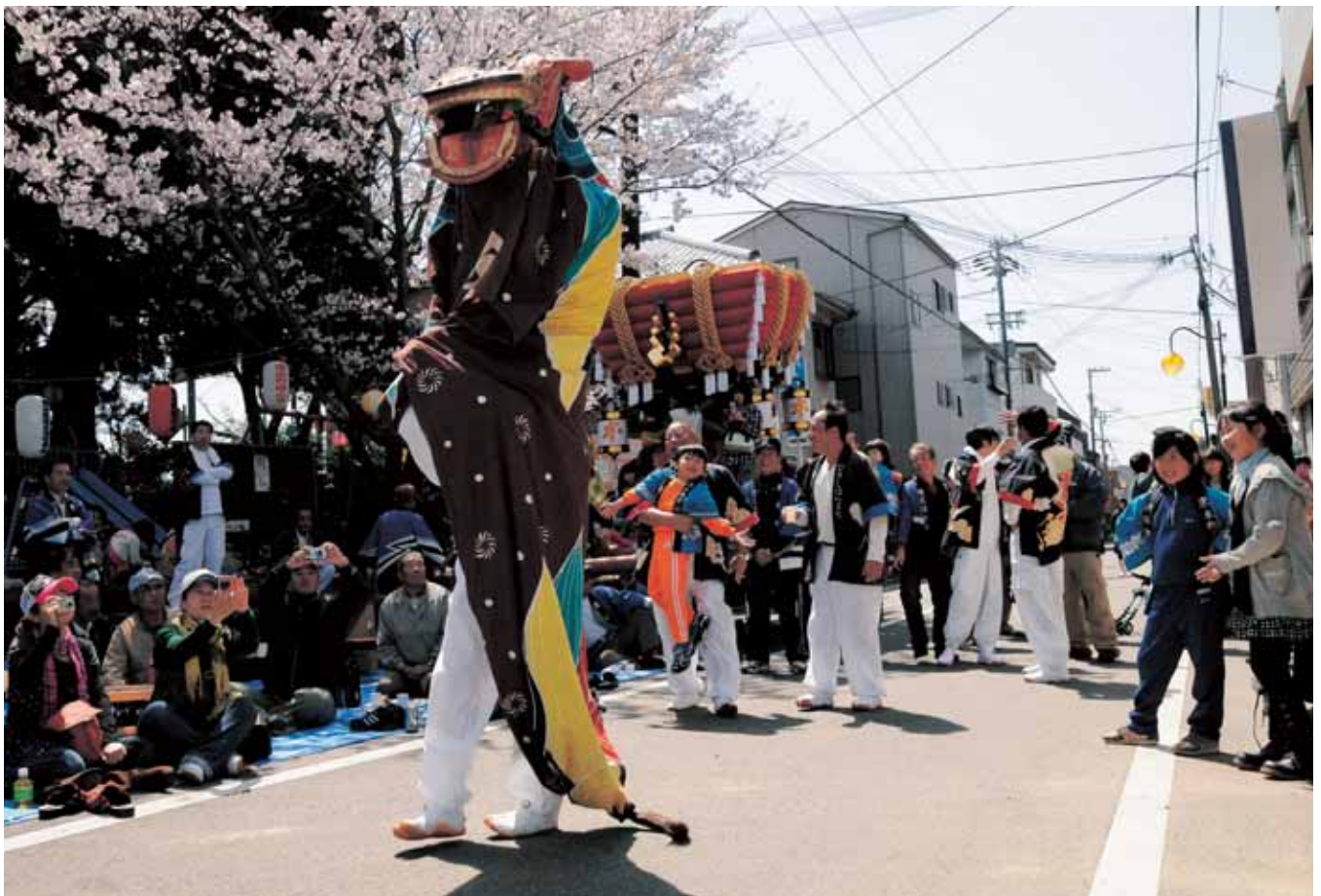
▲福良の春祭り（4月4日）