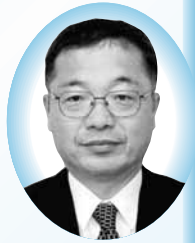
ゆづるはクラブ 原口 育大 議員

消防団等）を行なう。 交代制で各事務所に配置し、住民の顔が見える場所で、これまでの経験を活かしていただき、市民サービスの向上を図る。 市民への説明 これまで、会とい う会があるごとに市長以下の職員が地域へ出向き積極的に説明を繰り返してきた。財政状況も包み隠さず説明させていただいております。地域の方々は理解を示していただいていると考えている。持続可能な行政を行なうためにも説明し続けることである。