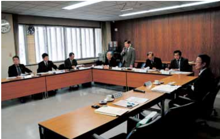
▲小松市議会で情報交換

き▼「議会報告会」を市内6箇所の公民館等で定期的に実施しており、議会及び行政全般について要望や提言を受けたいとのこと。地理的に近く、親近感をお互い感じつつのなかで、多くの有益なものを得た意見交換会であった。