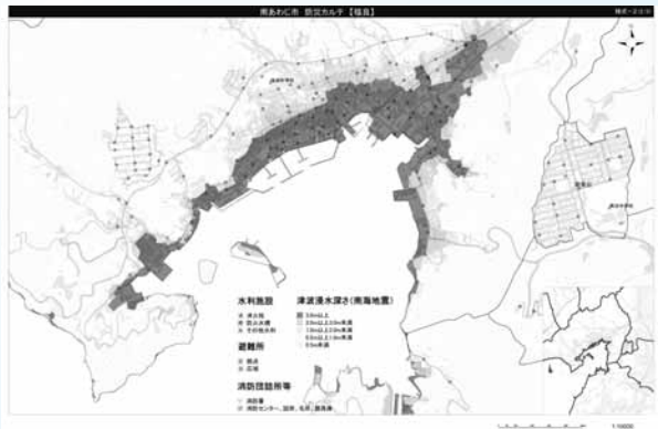
防災カルテ（福良地区）

とを前提に必要な装備物資の事前配置、防災拠点の整備など、環境整備を行うとなつているが。 都市整備部長 地域防災計画の中で対応する。 問 上田池ダムが決壊した場合のことが指摘されているが。 農業振興部次長 阪神淡路の地震までは耐えられる。 問 要援護者避難体制の構築の必要性が指摘されているが。 健康福祉部長 住宅地図でひとり暮らし老人、障害を持つ方々のお宅の図面化は完了。