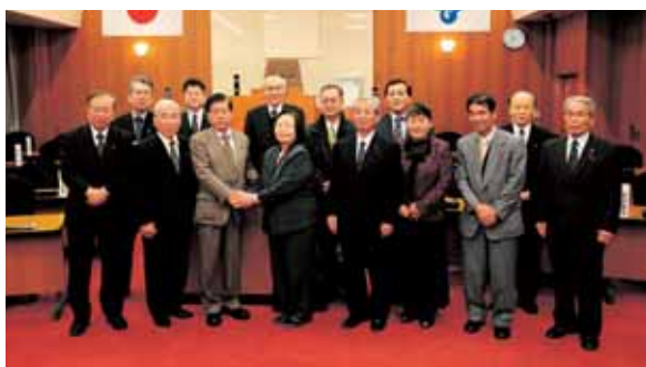
▲東かがわ市議会で意見交換

の特色は▼写真を多く盛り込み、全頁カラーを採用、読みやすさを意識してきたこと▼一般質問は各自半頁を割り当て、質疑内