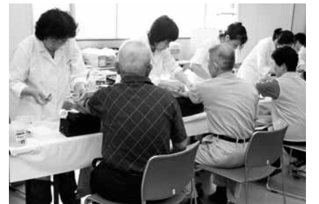
▲インフルエンザ予防接種(イメージ)

しについては、地域公共交通会議に利用者も入ってもらい検討を行っている。 歳出 問 新型インフルエンザワクチン接種料軽減事業の実施状況は。 答 対象者9931人のうち接種者は1713人で、優先接種できる時期にワクチンの製造が間に合わず、接種できるようなになった時点では積極的に接種する人が少ない状況であった。 問 沼島汽船株式会社赤字欠損、市として赤字を改善する方策を考えているか。 答 地元住民を含めた離島航路研究会を年1回開催し利用者の意見を聞いている。神戸海運局では21年度から離島航路改善協議会を立ち上げ、また、沼島汽船には市から随時指導を行っている。 問 行財政改革審議会の設置根拠は。 答 執行機関の付属機関は地方自治法により条例で定めることとなっているが要綱により設置している。 問 条例に基づかない審議会への報酬の支出は適法か。 答 報酬条例に基づき支出をしている。地方自治法の規定に定められている手続きを経ていない組織については、それにあたるかどうか調査をする。