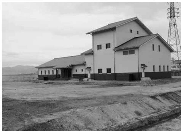
▲松帆・湊浄化センター(平成23年3月供用開始予定)