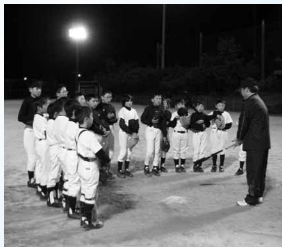
子どもたちに野球を教えている地域の指導者（阿万少年野球クラブ）

員適正化計画、また人事評価も出来るだけ根拠を的確にしないと職員の行動そのものも不信感に繋がる。従って評価をきっちり出来る体制をとっております。