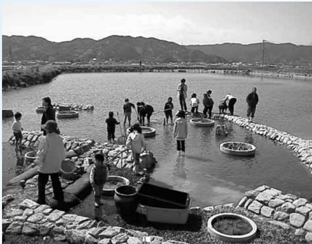
圃場整備における環境配慮事業(市西地区新ちやん公園)

問 コンサル業務にも最低制限を設けるべきではないか。 財務部長 今後の検討課題として考えたい。