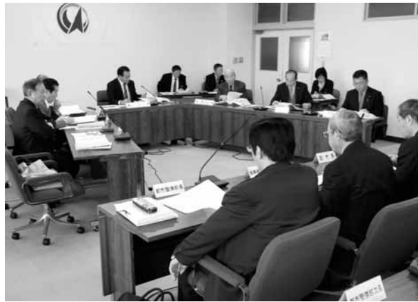
▲産業建設常任委員会の審査風景

答 全体の事業費は約 800億円で現在の計 画では平成37年度完了 予定としているが、延 びる可能性がある。