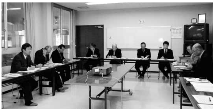
▲宍粟市の学校給食について調査