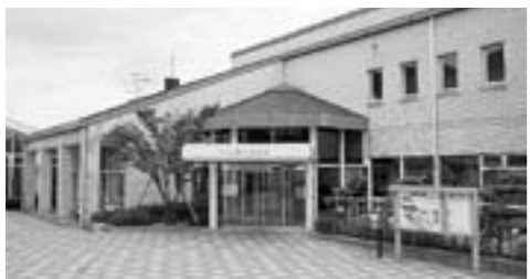
▲指定管理者が決定次第再開します

期間 指定管理者決定まで 休館施設 ①宿泊棟 ②浴場 ③工観光課 ☎37・3012