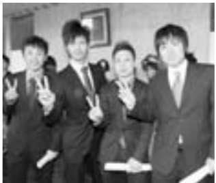
※市内に住民票を置いていない人も参加できます