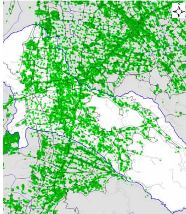
図 住宅の密集状況