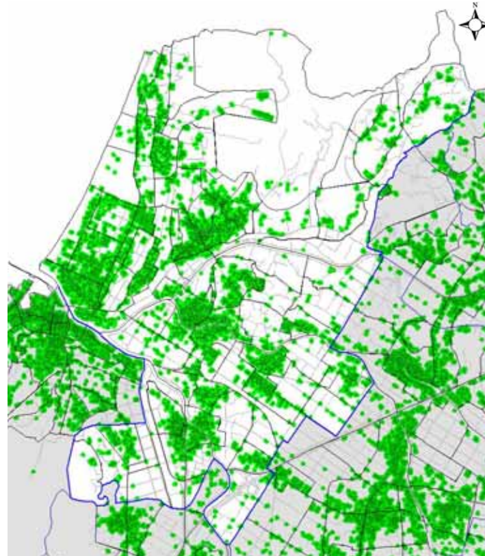
住宅密集地 建築物の立地状況から表示 図 住宅の密集状況

南あわじ市の課題を明らかにし、防災まちづくりを進めるために行った調査のことです。 ある地域が南あわじ市全体の中でどのくらい危険性が高いかを比較評価したものであり、地震災害の被害の規模を予測したものではありません。 災害危険度は、国のガイドラインに基づき、南あわじ市の地震災害に対する危険性の度合いを評価しています。