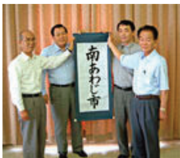
新市名候補が決定