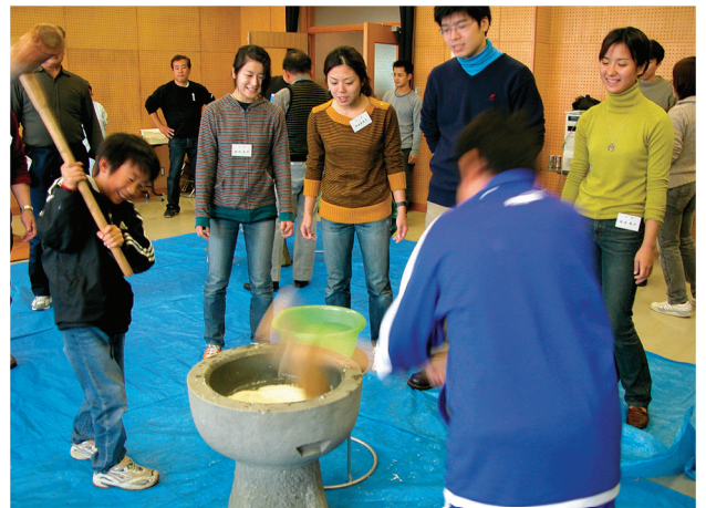
▲もちをつく参加者ら