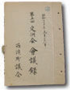
第5回定例会会議録

八日、西淡町第五回定例会議で、十月一日付で三原町へ分村する境界変更の件を議決し落着した。