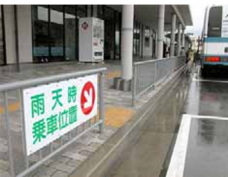
案内の看板を設置

け庇のあるところで停車しましたが、あとの三回は従来どおりの乗車位置でした。バス会社と早急に協議していただくのと、乗車位置の掲示板を設置願います。