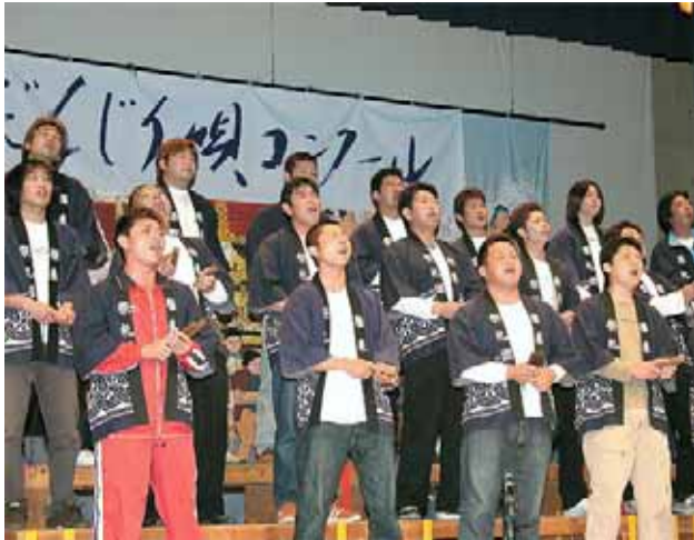
▲熱唱する雁来祭礼団

だんじり唄の保存と発展を目的とした「第15回淡路だんじり唄コンクール」が4月25日、西淡町中央公民館大ホールで行われ、西淡・三原・南淡・五色の4町から39団体約850人が出演。練習の成果を情感たっぷりに唄い披露すると、集まった観客から大きな歓声が上がっていました。