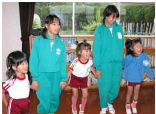
▶楽しそうに津井幼稚園と遊ぶ生徒