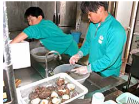
◀魚彩館でサザエを洗う生徒

役場企画政策課には御原中学校から4人の生徒が訪れ、広報紙づくりを体験。各職場のトライやる生を取材し、10～11ページを作成しましたのでご覧ください。