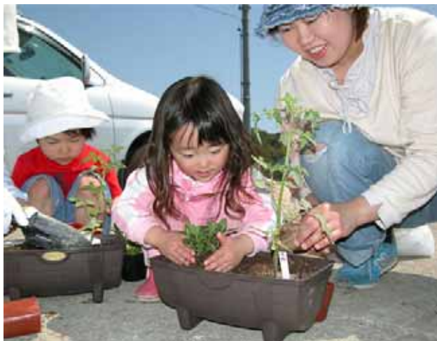
▲ミニトマトと食用ハーブを植栽する親子

また、寄植の鉢に植栽したミニトマトと食用ハーブは家に持ち帰り、大きくなるように水やりなどをして育てられます。