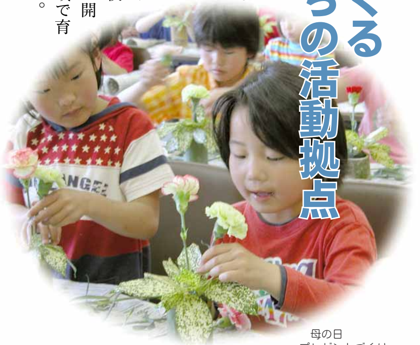
母の日 プレゼントづくり

子どもたちの異世代間の交流や、地域の大人による教育相談体制の確立を目的とした、文部科学省の「子どもの居場所作り事業」。西淡町では、地域のボランティアの力で御原校区と辰美中学校区の二か所に開設され、子どもたちを地域で育む取り組みが始まりました。