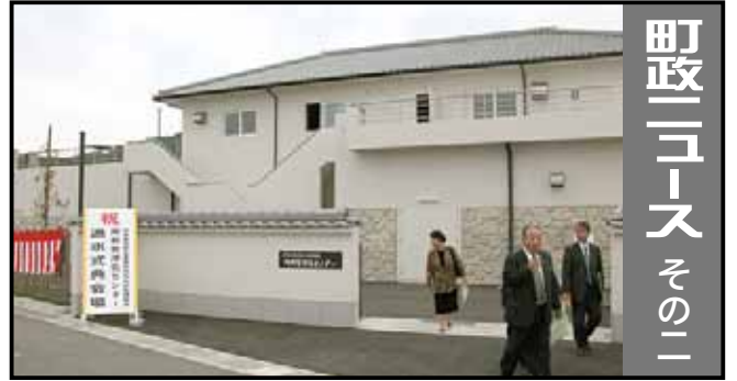
阿那賀浄化センター