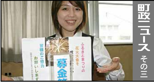
ふるさとまつり募金箱