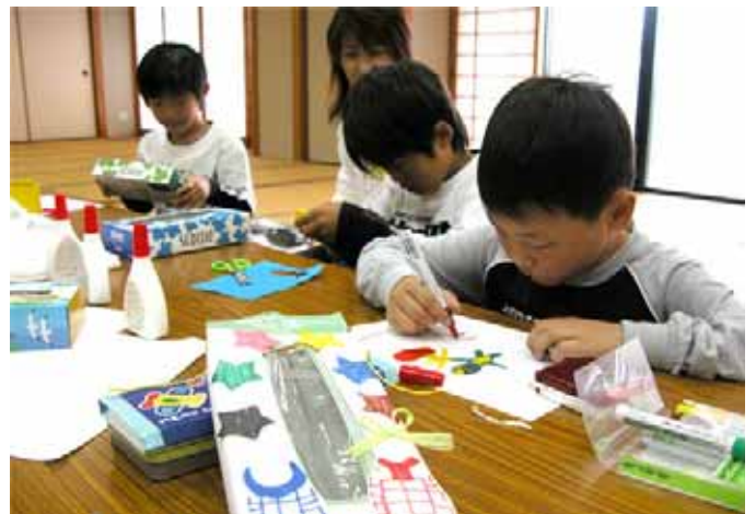
▲リサイクル工作（キッチングッズ）