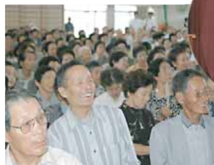
▲落語を楽しむ参加者