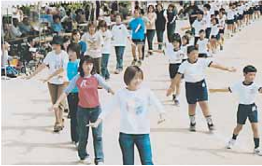
町民から親しまれている西淡音頭

町制十周年にあたる昭和四十二年、ふるさとソング「西淡音頭」が作られました。この音頭は町の背景をうまく歌い、リズム感も優れていることから、ふるさとまつりや文化芸能祭、小学校の運動会などで踊り親しまれています。合併後もこの踊りを通じて、西淡町の名が受け継がれていくことでしよう。