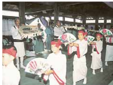
阿万風流踊り（文化庁選択文化財）

亀岡八幡宮に伝わる「阿万風流踊り」は、五穀豊穡と郷土繁栄祈願のため室町時代から始まったといわれています。干ばつに遭遇したとき、願いが叶えば神前にこの踊りを踊ることを告げ、願解きとして踊ったそうです。現在は、毎年九月十五日に奉納されています。声明がかつたゆるやかなテンポの歌から古雅な感じを受けます。