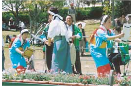
4・29グリーンフェアで披露された五尺踊り

五尺踊りは、淡路島最大の百姓一揆である「天明の繩騒動」で極刑に処せられた宮村才蔵らの霊を慰めるために始められたといわれ、毎年、才蔵の命日である三月二十三日には大宮寺裏山の「天明志士記念碑」前で奉納されます。また、この踊りの伝承に力を注ぐ五尺踊保存会や広田小学校郷土芸能部によってさまざまな行事で披露されています。