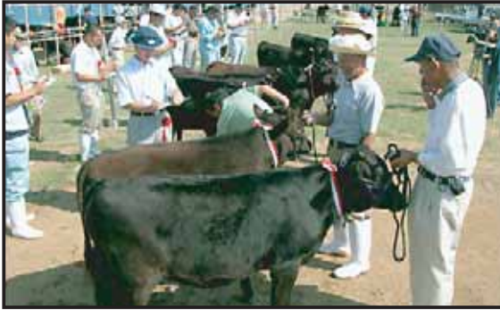
出品された牛を審査中