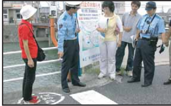
ストップマークなど標識を確認