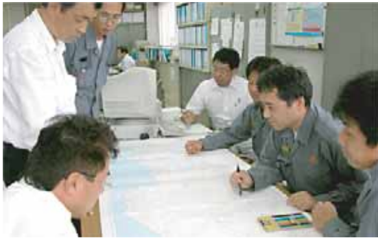
対策を練る本部と消防団