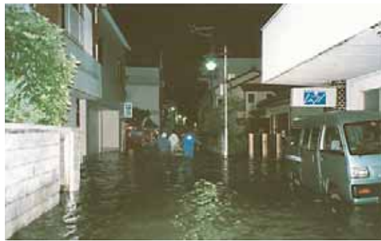
台風16号による湊地区浸水被害

八月三十日から三十一日にかけて大型台風十六号が、また九月七日には台風十八号が島内に接近し、暴風と高潮による被害が相次ぎました。