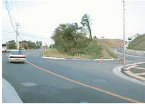
辰美小学校前の交差点

Q1 辰美小学校の前の県道はカーブになっていて危険と思います。歩道橋か信号機を取り付けていただきたい。