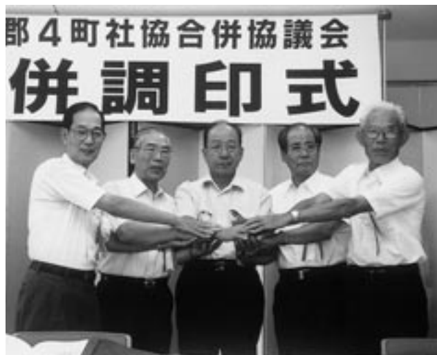
▲がっつりと手を取り合う4町会長と県社協・社会長（中央）