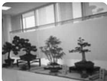
▲長年手入れを続けてこられた盆栽の数々