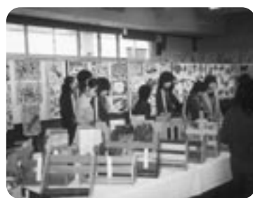
▲3階ホールには小中学生の作品がところ狭しと展示された