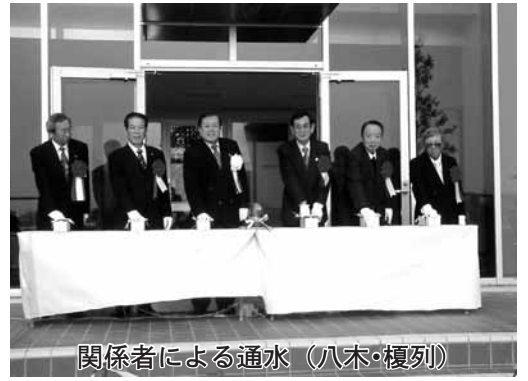
関係者による通水（八木・榎列）

平成十三年度から工事を進めていた神代浄化センターと八木・榎列浄化センターが完成し、十二月二十日現地で通水式典が行われました。