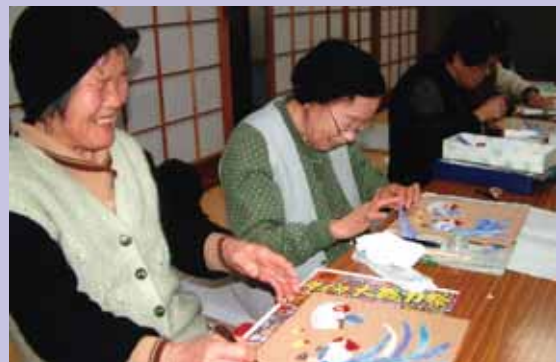
年末恒例の干支ちぎり絵づくり (12月20日 お達者教室)