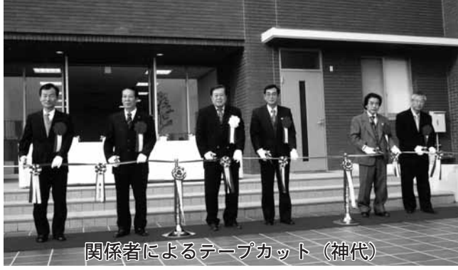
関係者によるテープカット（神代）