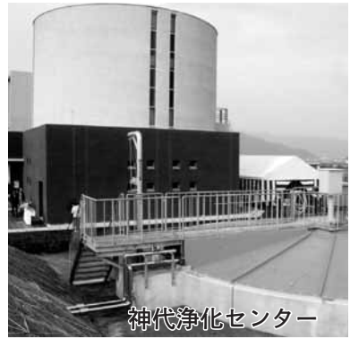
神代浄化センター