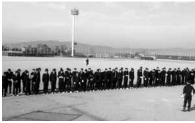
全団員最終礼式訓練 (12月12日 健康広場)

ケガや病気で障害が残ったと 021)へ 総合窓口(三原庁舎 ☎4315 加入手続きは、三原町住民生活課(☎4210322)まで。一月十一日以降は各庁舎