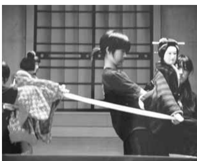
淡路人形芝居 写真

三原町人形まつりで公演した淡路人形芝居を郷土のアマチュア写真家九人が撮影した力作多数を展示します。是非ご覧下さい。