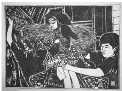
淡路人形カレンダー