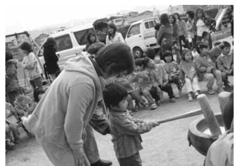
市保育所との交流 12月9日

新しい年を迎えました。子どもたちも楽しいイベントにわくわくときどき笑顔があふれていることでしょう。日頃の生活よりお腹等身体も少し疲れているかもしれません。大人のペースから子どものペースに心をかけましょう。そしていろんな人や家族とのふれあいを楽しみましょう。物質よりゆったりとした時間を大切にすることは、子ども心に響きます。