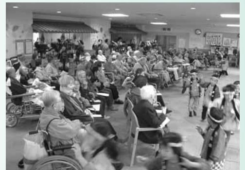
オープニングの阿波踊り