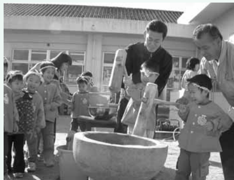
楽しいおもちつき大会