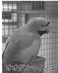
オオダグルマインコ