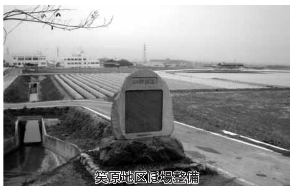
笑原地区ほ場整備

二五八一メートルが完成しました。 国分寺周辺では埋蔵文化財事務所により、遺跡の調査も行われ、国分寺の創建時に瓦を焼いた可能性が高い窯跡が二基発見され、見学会も開かれました。 農地の高度利用と農業の近代化を図り、農業の後継者に夢と希望を託す故郷が誕生しました。