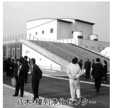
八木・榎列浄化センター

平成十三年度から工事を進めていた神代浄化センターと八木・榎列浄化センターが完成し、十二月二十日現地で通水式典が行われました。