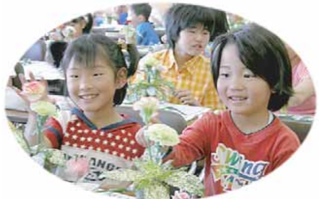
子どもの居場所作り事業

また、花を通じて人の輪が広がりつつあり、公園島淡路にふさわしい町となってきました。