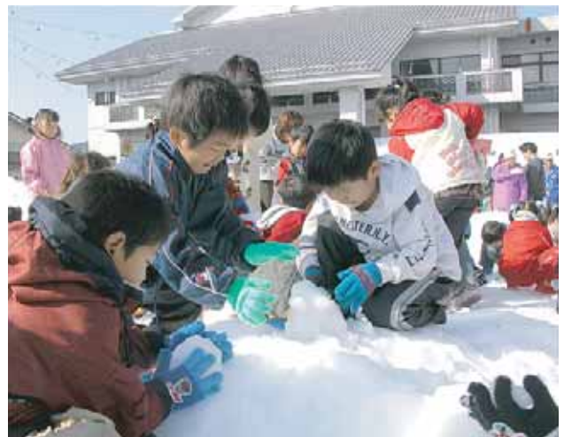
▲雪だるまを作成中