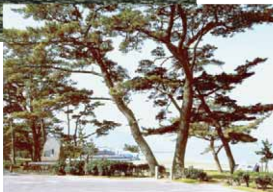
国の名勝 慶野松原