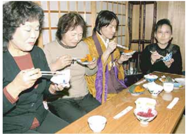
▲カボチャと大豆かゆに舌鼓を打つ参拝者ら

同祭は約300年前に淡路で飢饉が起こった際、同寺を開いた勝算和尚が人々にかゆを出して救済したのが始まり。その後、冬至に食べるカボチャは中風やボケ防止になるとされ、毎年カボチャと大豆かゆを振舞われています。