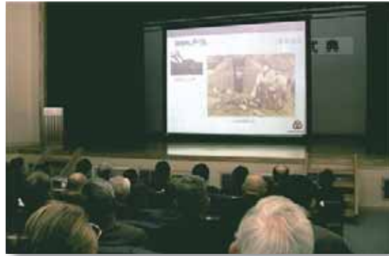
▲西淡町のあゆみスライドショー