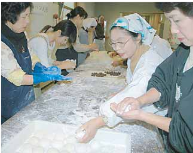
▲おもちを丸める民生児童委員など

おもちには同隊員からの手紙が添えられ、民生児童委員から老人にそれぞれ配られました。