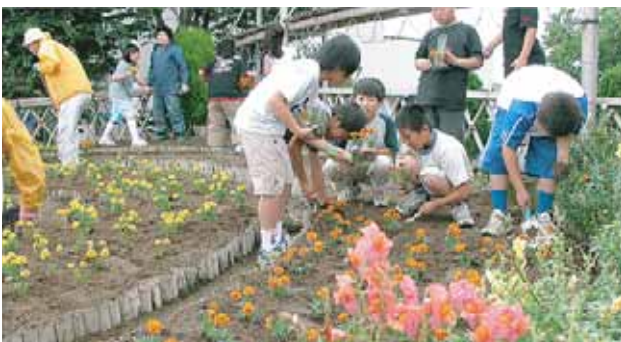
花づくりに参加する子どもたち