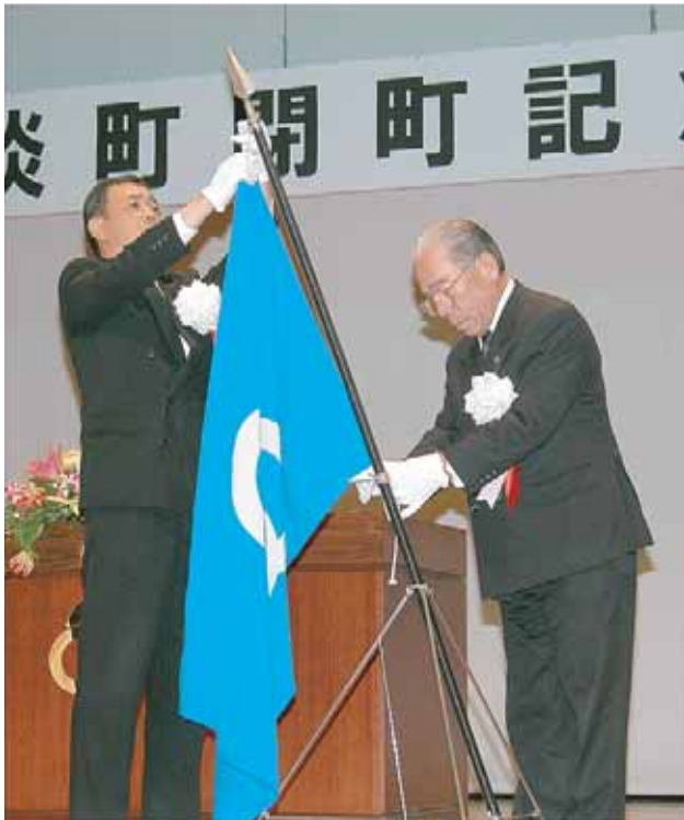
▲長江町長と川上議長が町旗を降納