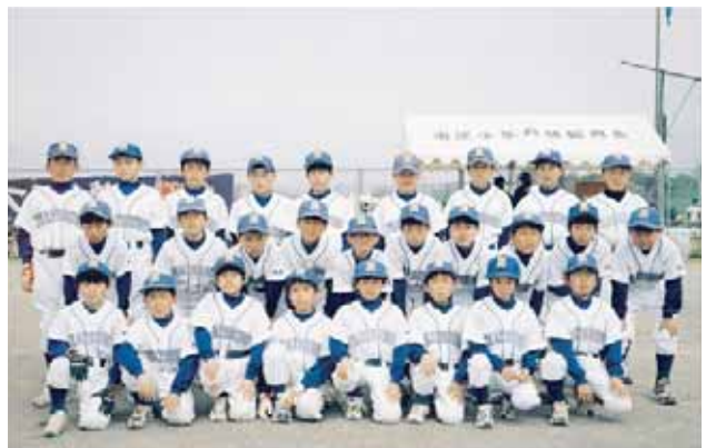
▲優勝した松帆少年野球クラブ