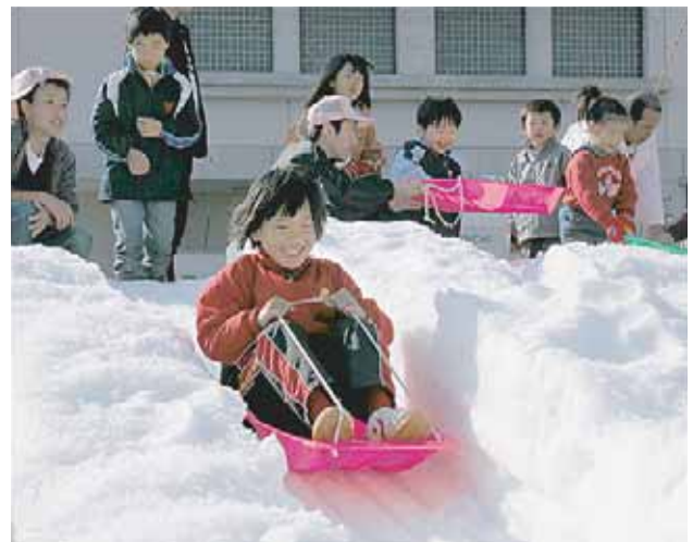
▲ソリ滑りを楽しむ子どもたち

同まつりは、雪を見る機会の少ない淡路島の子どもたちに雪遊び体験してもらおうと平成3年から毎年開催。この日も、子どもたちはソリ滑りや雪だるまづくりなどを楽しんでいました。