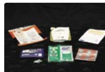
パン・お菓子の袋やレジ袋、商品の外側フィルムなど