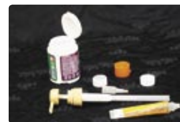
ペットボトルなどのふた