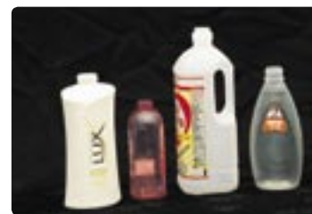
洗剤やシャンプー、調味料などの容器