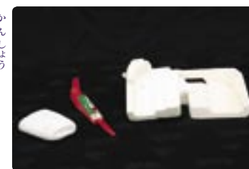
家電製品保護の発泡スチロールや、みかんのネットなど