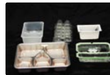
卵や豆腐、弁当などの容器