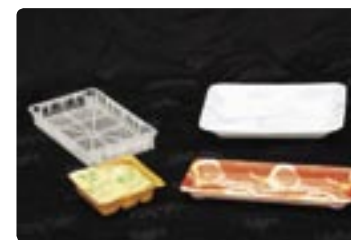
お惣菜やカレールーなどのトレイ(白色食品トレイは別)