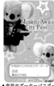
▲市民サポーターパスポート

▽窓口 商工観光課(西淡庁舎) ▽持参品 現行パスポート ※記載内容に変更のない方は無料で手続きします。変更がある方は本人が写った写真と材料費50円が必要です。