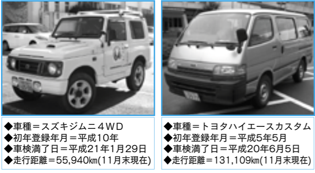
◆車種=スズキジムニ4WD ◆初年登録年月=平成10年 ◆車検満了日=平成21年1月29日 ◆走行距離=55,940km(11月末現在) ◆車種=トヨタハイエースカスタム ◆初年登録年月=平成5年5月 ◆車検満了日=平成20年6月5日 ◆走行距離=131,109km(11月末現在)

公用車2台を、制限付一般競争入札方式（提出は持参）により売却します。 ▽売却車両 トヨタハイエースカスタム、スズキジムニ4WD ▽受付期間 1月15日（火）～21日（月） ▽物件の確認 1月15日（火）午後1時～5時南淡庁舎公用車駐車場 ▽説明書配布 市ホームページ、総合窓口センター ▽管財課 ☎50・3034