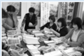
▲実行委員会が約7千の方々へ大会の募集要項を発送しました(11月15日、南淡公民館)

◆申込期限 1月15日(火) 図大会事務局 ☎53-1212 (西淡庁舎3階委員会室)