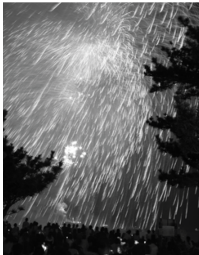
▲慶野松原海水浴場で打ち上げられた花火

午後8時30分からの花火大会では砂浜の家族連れなどから、色とりどりに広がる大輪の花火に歓声があがりました。家族や友人、恋人へのメッセージ花火には10組が応募し、感謝と幸せを願う気持ちが披露されました。