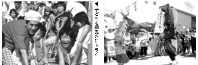
▲子どもも網曳きにトライ

この祭りは平成8年から続く恒例行事。実行委員は「毎年楽しみにしてくれている人がいる。今年も多くの笑顔が見られてよかった」と話していました。