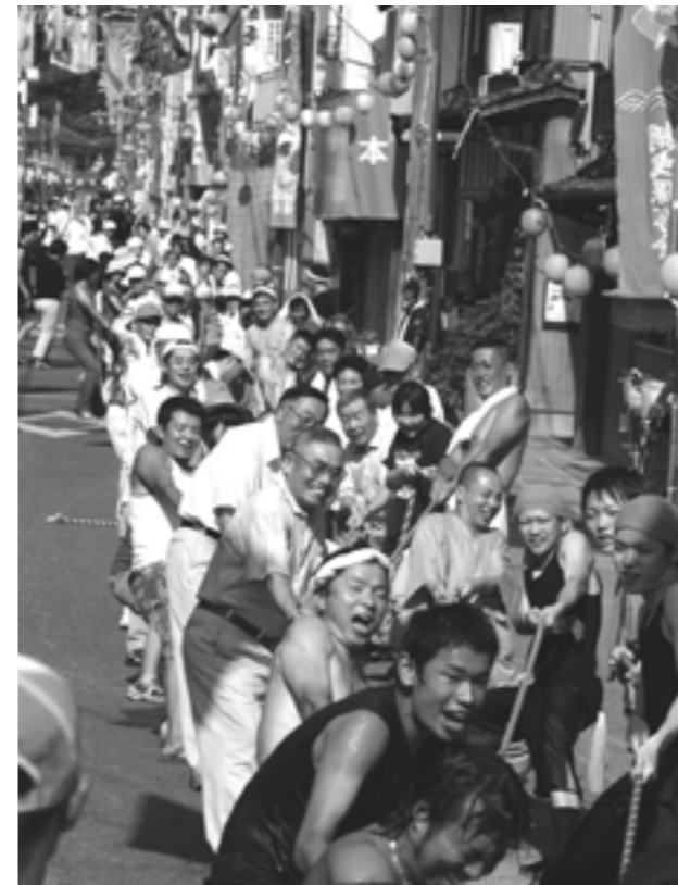
▲掛け声を合わせて力いっぱい綱を曳きます（8月14日、慈眼寺前）

盆踊りには、自治会や愛好者、同級生らで組織する阿波踊りやよさこい踊りの22連が参加。多くの観客が集まる3つの踊り場や街中を練り歩きました。2日間にわたって、まちは人の熱気と賑やかな鐘や太鼓の音に包まれました。