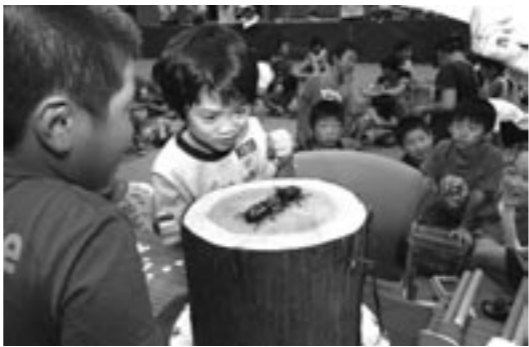
▲カプトムシの戦いに声援を送る子どもたち

このイベントは、親子で夏休みの思い出をつくり、生き物の大切さを学んでもらおうと、昨年に引き続き開催したもの。大会には、近くの山でお父さんと一緒に捕まえたカプトムシや外国産の高価なものなどが入り混り、熱戦が繰り広げられました（11頁に大会結果）。