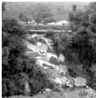
▲河川に捨てられたゴミ

街の空き地や道路沿い、河川等に廃棄物の不法投棄が増加しています。 このままでは街がゴミ箱となり、美しい淡路島のイメージが損なわれ、観光にも悪影響を及ぼしかねません。また、河川内のゴミは、河川災害につながります。