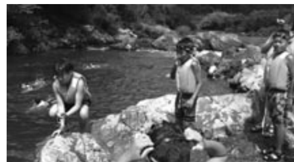
▲あそび塾「最後の清流・川遊び隊」

四万十川は、とってもきれいで冷たくて最高でした。汚いっていう人なんて、どこを探してもいないと思いました。 冷たい川でたくさん遊んで疲れたら、岩の間にある小さな