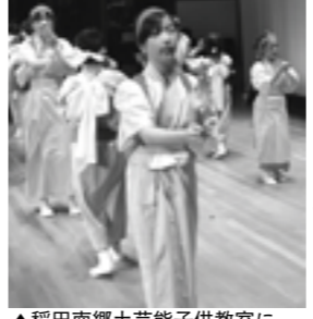
▲稲田南郷土芸能子供教室による郷土芸能「机くつし」

日時 9月3日(日) 午前10時~午後4時. Details about the festival including location and participating groups.