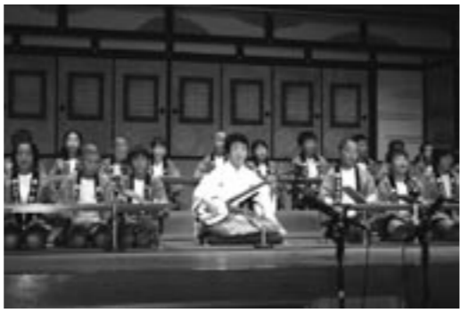
▲浄瑠璃語りを披露する市小学校郷土文化部

淡路人形浄瑠璃を受け継ぐ団体による「淡路人形浄瑠璃後継者団体発表会」が八月五日、三原公民館で開催され、七団体の二百人が日ごろの練習の成果を披露しました。