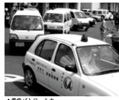
▲青色パトロールカー