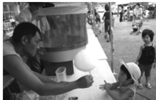
▲綿菓子の屋台（倭文ふれあい夏祭り）