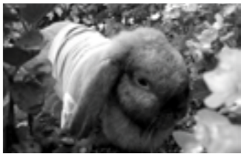
◀メルヘンの世界へ誘う「ラビットガーデン」