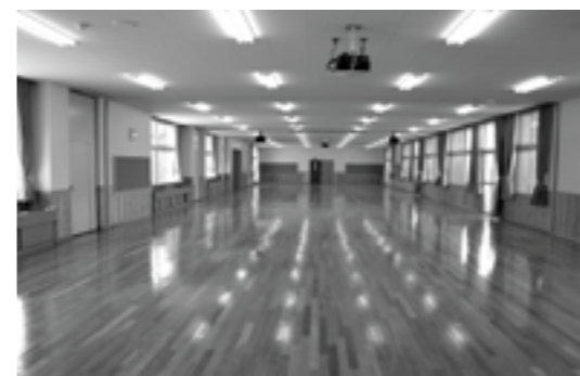
▲260人が食事をとることのできる多目的視聴覚室

改築前の松帆小学校南校舎は、昭和三十六年に新築、同四十一年に増築、同六十二年に改造工事が行われました。阪神淡路大震災の後、耐力度調査で構造上危険であると判定され、建替えを行いました。新校舎建築にあたっては、「地域住民と一緒に子どもを育てる」をテーマに、地域に開かれ、交流を図ることができ、施設を整えました。また、地元特産の瓦を屋根に使用、教室内には木材を使用しています。安全対策として、防犯カメラや非常ベルを設置し、