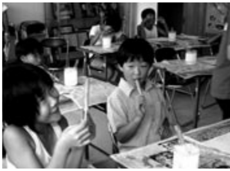
▲100円塾（アイスクャンデーづくり）

人たちなどふれあつてもらおうと、市教育委員会では「あそび塾」や「100円塾」を開催。両講座合わせて、延べ約千六百人が参加しました。「あそび塾」では市内で海洋スポーツをしたり、ミス터리ナイトウォーク（肝だめし）をしたり、また島外に出