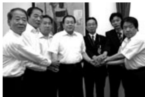
▲中田市長と握手を交わす市内の量販店・安全協力会代表者ら

七月二十八日、市長室で協定の締結式が行われ、中田市長から「南あわじ市は南海地震をはじめ、自然災害に見舞われる危険性が高い。皆さま