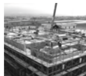
1階の型枠組立て(平成18年2月24日)