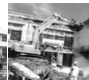
旧校舎の取り壊し(平成17年10月1日)