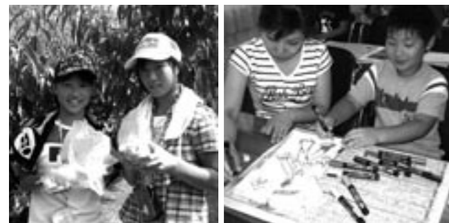
▲あそび塾「ももがり」 ▲あそび塾「オリジナルTシャツ作り」

四万十川は、とってもきれいで冷たくて最高でした。汚いっていう人なんて、どこを探してもいないと思いました。 冷たい川でたくさん遊んで疲れたら、岩の間にある小さな