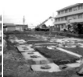
校舎を支える118本の基礎杭(平成17年11月22日)