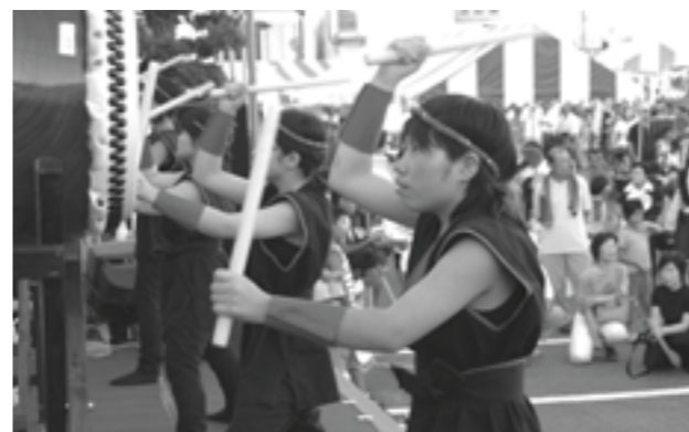
▲和太鼓の舞台演奏（みどりどんとこい夜店）