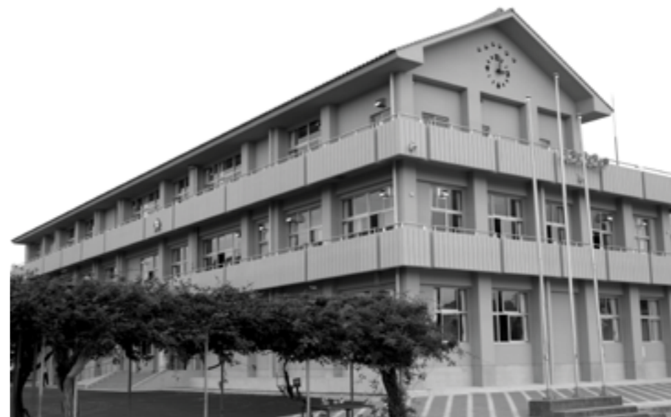
▲松帆小学校南校舎

改築前の松帆小学校南校舎は、昭和三十六年に新築、同四十一年に増築、同六十二年に改造工事が行われました。阪神淡路大震災の後、耐力度調査で構造上危険であると判定され、建替えを行いました。新校舎建築にあたっては、「地域住民と一緒に子どもを育てる」をテーマに、地域に開かれ、交流を図ることができ、施設を整えました。また、地元特産の瓦を屋根に使用、教室内には木材を使用しています。安全対策として、防犯カメラや非常ベルを設置し、