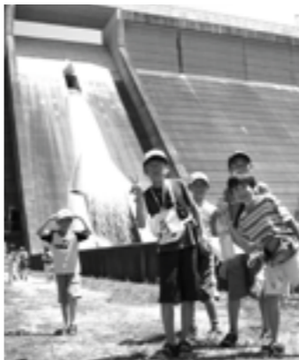
▲ダム周辺を回る子どもたち

内部や管理所、湖などを一時間かけて回るウォークラリーをメインに、うなぎのつかみ取りやヨーヨー釣りなども行われ、夏の日差しが降り注ぐ中、子どもたちは夢中になってゲームを楽しみました(十一頁に関連記事)。