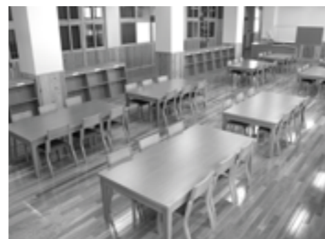
▲2階オープンスペース周辺には本棚を設置