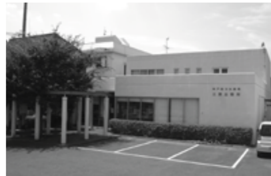
▲統合される法務局三原出張所

神戸地方法務局三原出張所が10月16日(月)をもって、同洲本支局へ統合します。 統合に伴い、三原出張所を取り扱っていた登記事務は、同日から洲本支局においてコンピュータにより扱います。 長年にわたるご厚情に対し、心からお礼申し上げます。 神戸地方法務局総務課 ☎078・392・0461、洲本支局 ☎22・0497