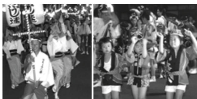
▲元気な掛け声をあげながら福良の街中を回る踊り子たち