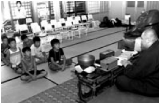
▲あそび塾（一泊住職体験）