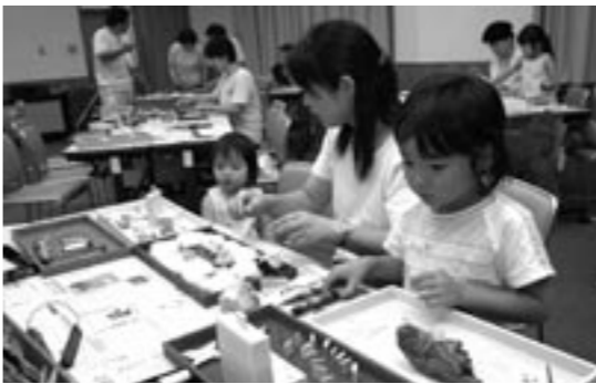
▲絵本づくりに挑戦する参加者