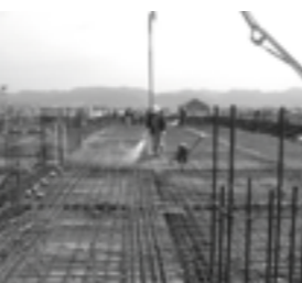
2階天井の鉄筋(平成18年4月19日)