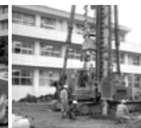
長さ7mの基礎杭を打設(平成17年11月10日)