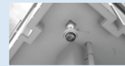
▲子どもたちを見守る防犯カメラ