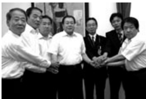
▲中田市長と握手を交わす市内の量販店・安全協力会代表者ら

七月二十八日、市長室で協定の締結式が行われ、中田市長から「南あわじ市は南海地震をはじめ、自然災害に見舞われる危険性が高い。皆さま