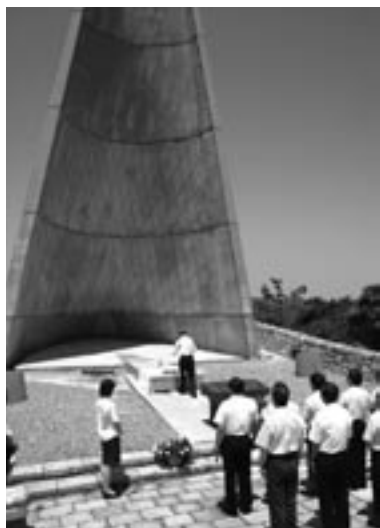
▶慰霊塔の前での献花式