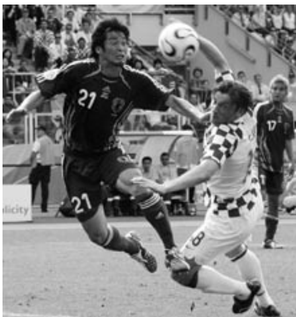
▲大舞台に立つ加地亮選手