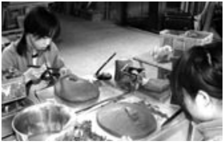
▲自分の顔をモデルにした写作品づくり