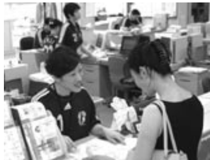
▲代表カラーのTシャツを着用し、業務にあたる市職員（西淡総合窓口センター）

りの品々を展示した「加地亮展」を西淡公民館で六月一日～二十二日まで開催。多くの人が訪れました。