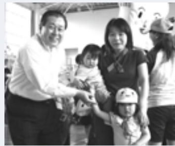
▲子育て学習センター運動会にて