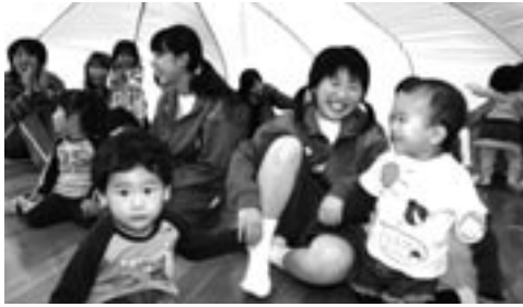
▲子育て学習センターの2歳児とのふれあい