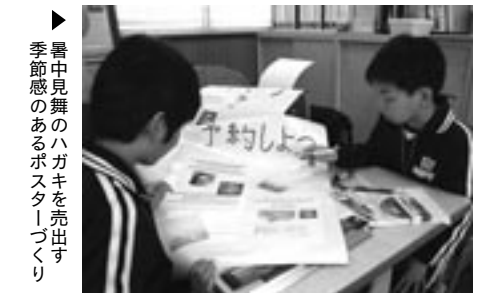
▶暑中見舞いのハガキを売出す季節感のあるポスターづくり