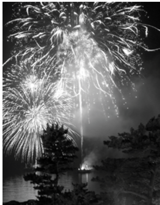
▲ 慶野松原花火大会