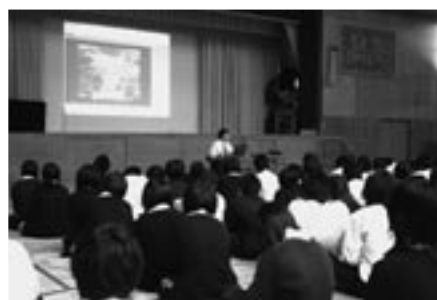
▲志知高校での防災出前講座の様子

地面は固さや性質が違う土や石がいくつもの層になって、積み重なってできています。地下水が粘土のような、すべりやすい層にしみ込み、