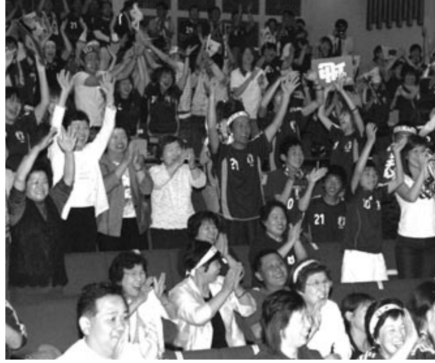
▲力強い「ニッポン」「カジ」コールで応援する来場者（西淡公民館でのスクリーン観戦会）