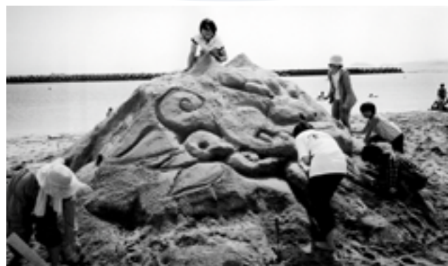
▲ サンドアートコンテスト