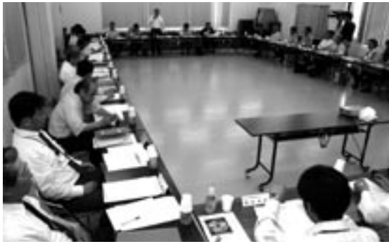
▲地域防災計画を協議する関係者