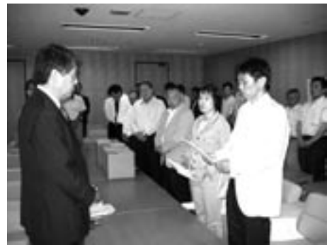
▲8学級確保を求めた34,286人の署名を提出する市連合PTA役員ら