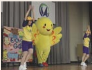
▲参加者の前で「はばタンダンス」を踊るはばタンレディ

国体開催まで一四〇日を切った五月中旬、国体推進に頼もしい助っ人が現れました。トライやるウイーク