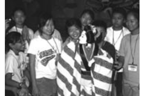
▲淡路人形浄瑠璃を遊ぶシンガポールの小学生