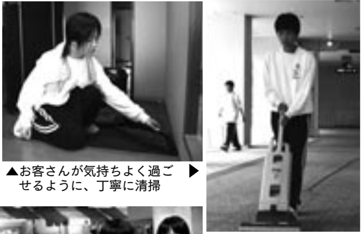
▲お客さんが気持ちよく過ごせるように、丁寧に清掃