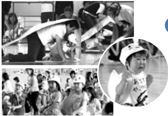
▶子育て学習センター合同運動会(三原健康広場)