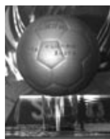
▲印の「瓦」が「いぶし」メッセージボール「いぶし瓦」が刻印されたサッカーボール

さらに、淡路瓦工業組合では、応援メッセージが刻印された「いぶし瓦」のサッカーボールを製作しました。