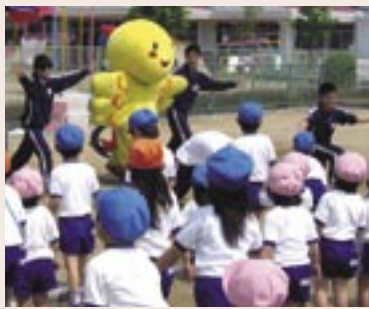
▲園児らと一緒に「はばタンダンス」を踊るトライやる生