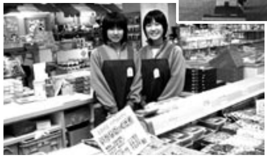
▲レストランと土産物店では笑顔と大きな声で接客