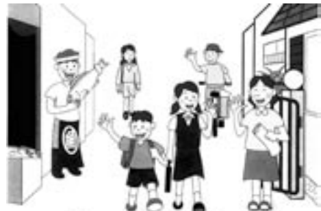
ちかくに いつでも きっと

「ハートブリッジ」は、「心のかげはし」を意味します。日常のあいさつなどの声かけ、見守り等を通して、子どもと大人が顔の見える関係を築きます。