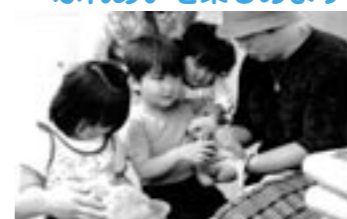
動物ふれあい広場

◆開園時間= 9:00～18:00 ◆入園料=大人 800円/小人 400円 ◆電話= 43-2626