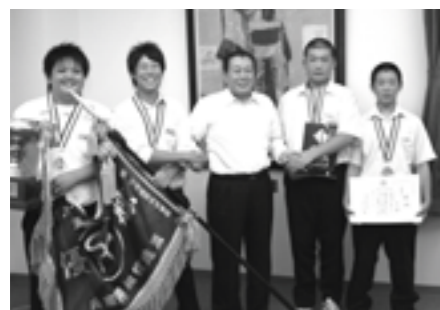
▲市長(中央)へ報告に訪れた県中学生相撲選手権大会団体優勝の「三原」チーム