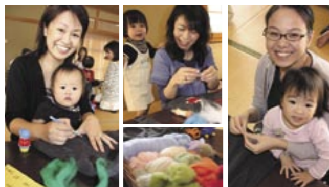
▲ママ広場のフリースチーク羊毛教室では、フリース生地羊を埋め込み、子ども用のスカートやズボン、ベストを製作しました(10月12日)