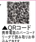
▲QRコード 携帯電話のバーコードリーダで読み取りお申込みできます