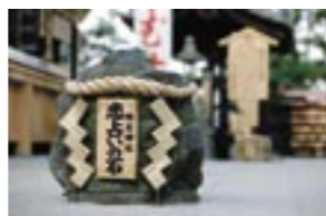
▲えんむすびの神様・地主神社の「恋占いの石」。10月のイベントは、京都旅(えんむすび神社・坐禅体験)でした