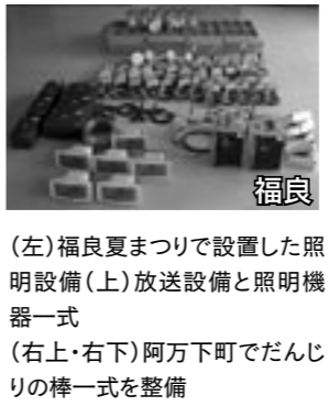
(左)福良夏まつりに設置した照明設備(上)放送設備と照明機器一式 (右)阿万下町でだんじりの棒一式を整備