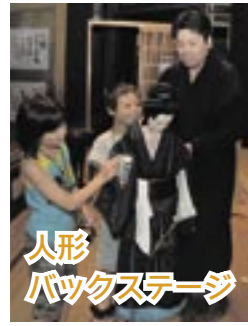
人形 パックスステージ