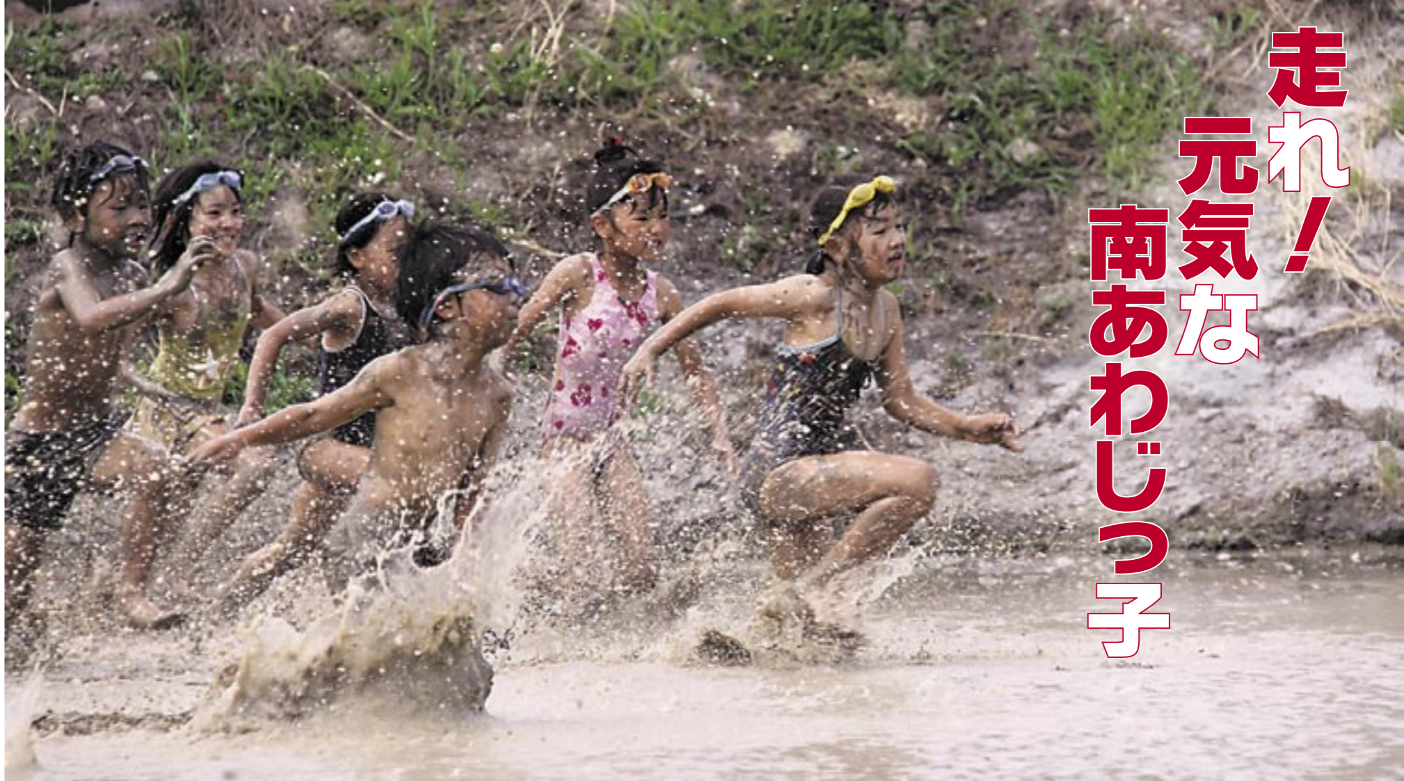
▲泥だらけになり必死で遊びを楽しんだ「泥りんピック」