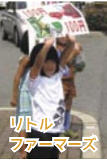
リトル ファーマーズ

夏休みは、子どもの好奇心をくすぐる数々の遊びを通して、子どもたちの心に大きな成長をもたらします。 わんぱく塾では、「遊び」＝「おもしろい」「たのしい」を、目いっぱい体験してもらい、そこから何かを悩み・気付き、学んでもらいます。 同塾の担当職員は、「たとえ富士登山に参加した子どもは、実際の富士山が写真で見るとは大きく違うことを実感します。登れば溶岩がごつごつとした茶色の山。遠くから見た風景と近くから見ると風景の違いに、子どもたちは悩むときがあります。どんなものでも外から見ると中から見るのとでは違うことを一つ学びます」と話します。 一つ一つの体験は小さなものかもしれませんが、しかし、それらの小さな体験は、きっと子どもたちの心に、学びをもたらしたくましいものへと成長させるのではないのでしょうか。