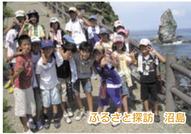
ふるさと探訪 沼島