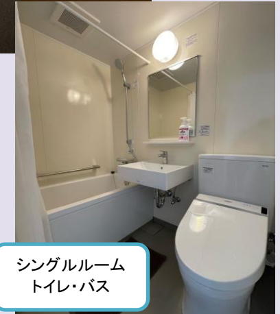
シングルルーム トイレ・バス