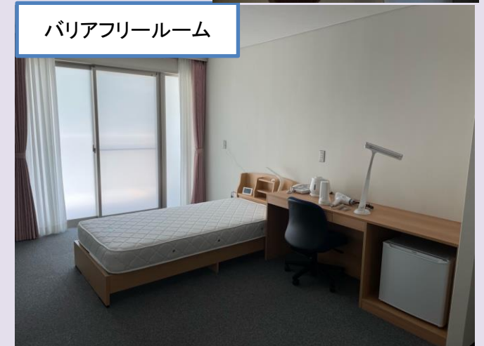
バリアフリールーム