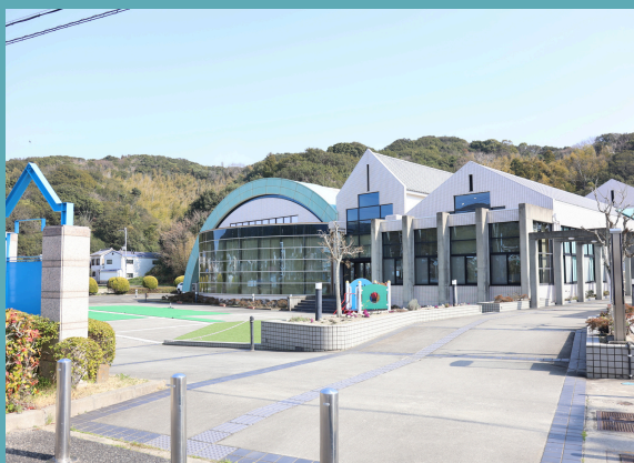
南あわじ市立図書館