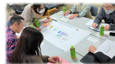
市民ワークショップの様子