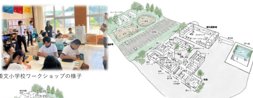
倭文中学校ワークショップの様子