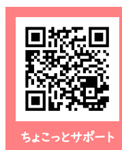
ちょこっとサポート

公益社団法人 南あわじ市シルバー人材センター ☎45-0012 (南あわじ市広田広田1064番地)