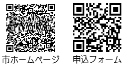
市ホームページ 申込フォーム