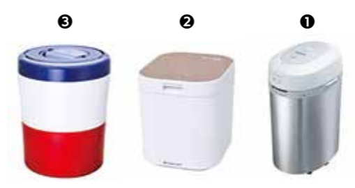
貸し出しする生ごみ処理機

申込方法 本人確認書類(運転免許証等)をお持ちのうえ、環境課または沼島出張所で申込みください。 ※台数に限りがあるため、先着順で貸し出します。電気代は利用者負担となります。