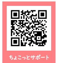
ちょこっとサポート

公益社団法人 南あわじ市シルバー人材センター ☎45-0012 (南あわじ市広田広田1064番地)