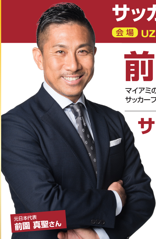
元日本代表 前園 真聖さん