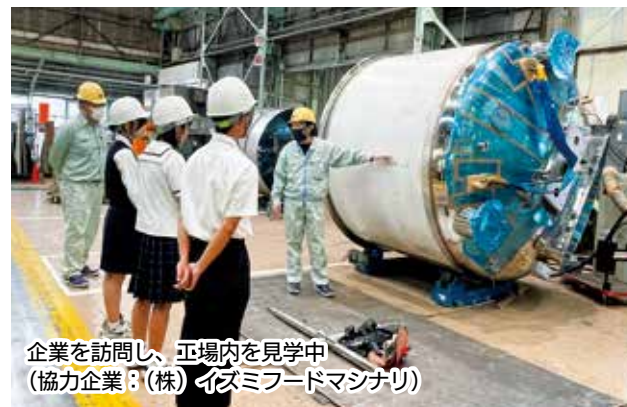
企業を訪問し、工場内を見学中 (協力企業：(株)イズミフードマシナリ)

市内に有名な商品を製造する機械を作っている企業があることを初めて知りました。みんなが働きやすい環境をつくるためにいろいろな取り組みをしていることを伝えたいです。