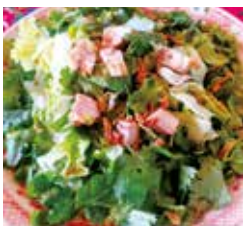
ベトナムビストロ onion