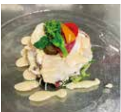
ホテルニューアワジ プラザ淡路島