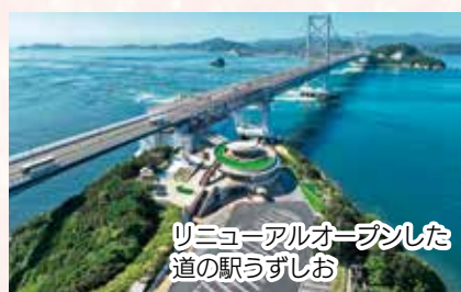
リニューアルオープンした道の駅うずしお