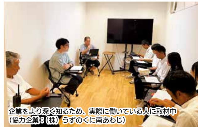
企業をより深く知るため、実際に働いている人に取材中 (協力企業：(株)うずのくに南あわじ)

淡路三原高校では、社会の仕組みや地域の魅力・課題を知ることが目的に、探究学習を行っています。取り組みを進める中で、学生たちは「自分たちも地元企業のことをあまり知らない。まずは自分たちが地元企業を知り、魅力を発信することで、同年代の学生も含め、より多くの人に地元企業を知ってほしい。」という思いから、本コンソーシアム参画企業にご協力をいただきながら、学生自らが企画・撮影・編集し、企業紹介動画を作成しています。