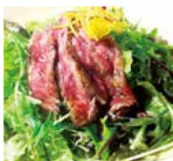
玉ねぎ倉庫跡地 志知カフェ