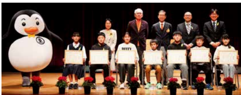
同作文コンテストで入賞した児童・生徒ら