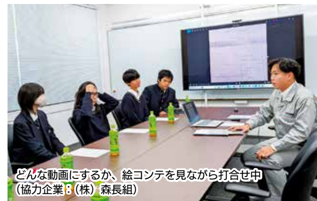
どんな動画にするか、絵コンテを見ながら打合せ中 (協力企業：(株)森長組)