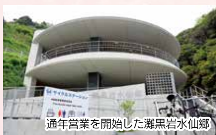
通年営業を開始した灘黒岩水仙郷