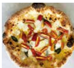
淡路ファームパーク イングランドの丘 石窯ピッツァ工房