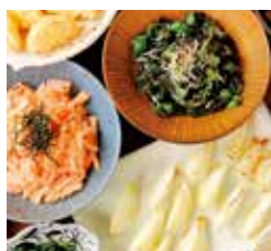
収穫食祭 (美菜恋来屋2階)