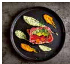
淡路島肉井製作所 牛と米