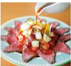
絶景レストラン うずの丘