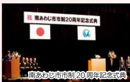
南あわじ市市制20周年記念式典