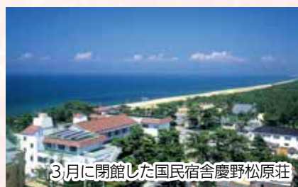
3月に閉館した国民宿舎慶野松原荘