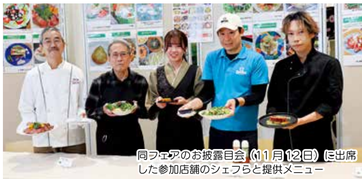
同フェアのお披露目会(11月12日)に出席 した参加店舗のシェフらと提供メニュー

■島サラダ×ベジスイーツフェアのホームページでは、事業参加店舗のシェフ、料理人が「シェフの旬野菜レシピ紹介」コーナーで旬野菜を使ったご家庭でできる簡単レシピを紹介しています。