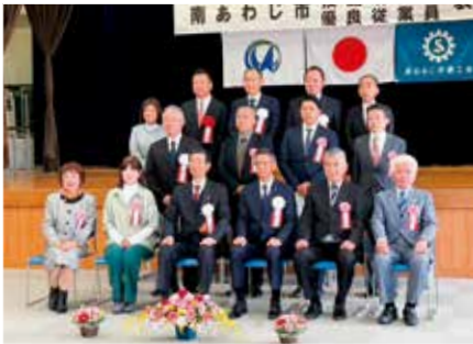
技能功労者表彰式の様子

長年優れた技能で職業に従事し、地域社会の発展や後継者の育成に貢献した人をたたえる「南あわじ市技能功労者表彰式」が11月23日、市役所第2別館多目的ホールで行われました。また同日、市商工会が主催する南あわじ市優良従業員表彰式も催され、40人が表彰されました。