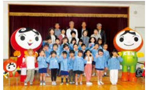
人権教室に参加した八木保育所の園児ら

図書館で不要になった本を有効活用するため、皆さまに無償でお持ち帰りいただけるイベントを開催します。 日時 12月14日(日) ※なくなり次第終了します 場所 市立図書館三原分館 内容 一般書、児童書(雑誌はありません) ※おひとりさま10冊まで ※ご家族分のお持ち帰りはできません(必ず本人が来館してください) ※お持ち帰り用の袋は、各自でご持参ください 市立図書館三原分館 ☎ 43・5037