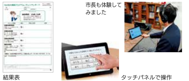
市長も体験してみました タッチパネルで操作 結果表 ※この機器は、明治安田の「私の地元応援募金」寄付金で購入しています

市では、MCI（軽度認知障害）や認知症状がある人を早期に発見するための認知症スクリーニング機器を導入しました。 このプログラムは、タッチパネルによるセルフチェック方式で、質問項目は少なく約5分で実施可能。誰でも簡単にテストできます。今後は認知症カフェのほか、介護予防出前講座、高齢者のイベントなどでの活用を予定しています。