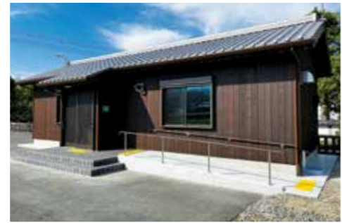
宝くじの助成金で整備した生子地区第二集会所

一般財団法人自治総合センターでは、宝くじの受託事業収入をもとにコミュニティ活動の健全なる発展を図るコミュニティ助成事業を実施しています。