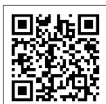
兵庫県 CG ハザードマップ