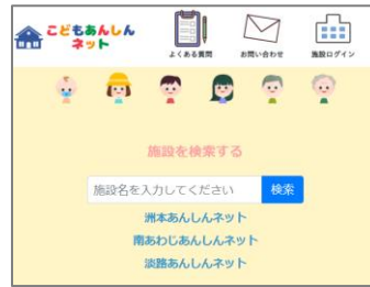
【施設名や地域から検索】